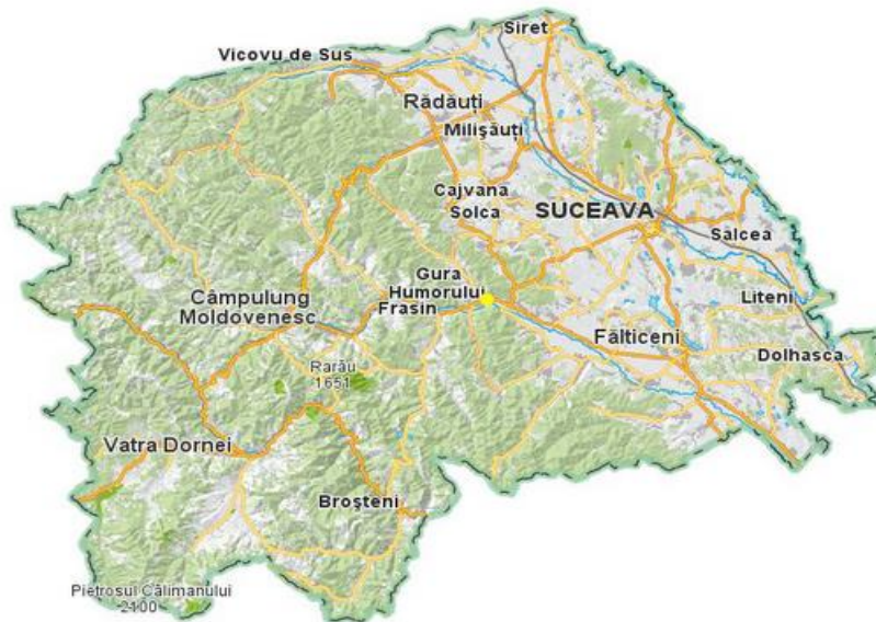
Fig. 1 Harta județului Suceava

Orașul este străbătut de șoseaua europeană E576 (DN 17), fiind poziționat la jumătatea distanței dintre Suceava și Câmpulung Moldovenesc, la circa 35 de km de aceste două centre urbane. Cel mai apropiat oraș de Gura Humorului este Frasin (7 km, către Câmpulung Moldovenesc). Altă cale rutieră care străbate orașul este drumul județean DJ 177, către comuna Mănăstirea Humorului, pe valea râului Humor. Gura Humorului este conectat la sistemul național feroviar și are două stații CFR pe magistrala Suceava – Vatra Dornei: Gura Humorului Oraș (în apropiere de centrul localității), respectiv Gura Humorului (în satul Păltinoasa din cadrul comunei suburbane cu același nume).